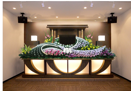
充実した設備・柔軟なサービス