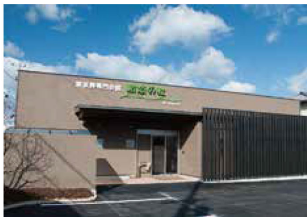
駅から近いきれいな斎場

祭壇の生花の量も多く、供花・盛籠などをご準備しなくとも十分な見栄えでお見送りされたい方におすすめのプランです。