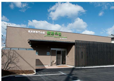
駅から近いきれいな斎場

「結悠プレミアムプラン真想～しんそう～」は上質な生花飾りの祭壇で故人を見送るプランです。季節の花やデザインでオーダーメイドできます。 基本オプションは「結悠プラン」を引き継ぎ、さらに湯灌の儀をお選びいただく事が可能となります。 こだわりの生花飾りで送られたい方におすすめのプランです。