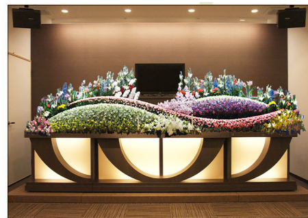
充実した設備・柔軟なサービス