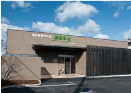
駅から近いきれいな斎場

「偲～おもかげ～プラン」は、費用を抑えてシンプルにお見送りされたい方におすすめのプランです。