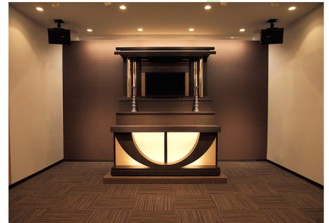
充実した設備・柔軟なサービス