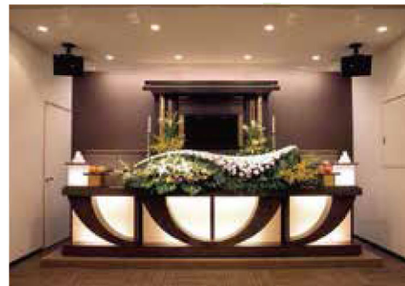
充実した設備・柔軟なサービス