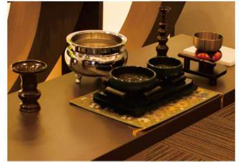
充実した設備・柔軟なサービス