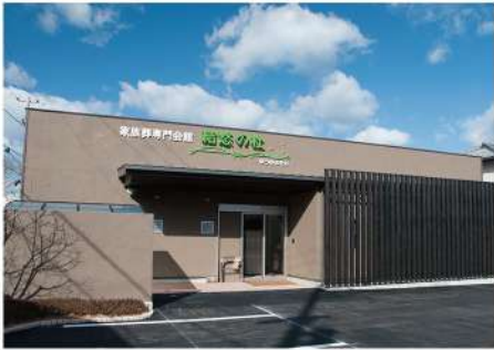
駅から近いきれいな斎場

「直葬(火葬式)プラン」は、通夜や告別式などを行わず火葬のみで故人様をお送りする最も費用を抑えたプランです。 ただ、お付き合いされているお寺様等がいらっしゃる場合は最初にご相談いただく事をおすすめします。