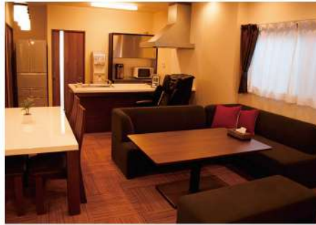
木のぬくもりを感じる癒やしの館内