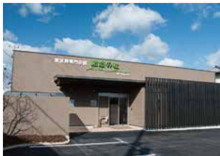
駅から近いきれいな斎場

「結悠プラン88」は最も豪華な家族葬プランです。「結プラン73」よりも、お棺一式などの基本オプションも豪華なものになっております。祭壇の生花の量も多く、華やかにお見送りされたい方におすすめのプランです。