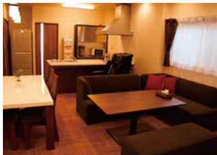
木のぬくもりを感じる癒やしの館内