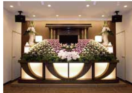
充実した設備・柔軟なサービス