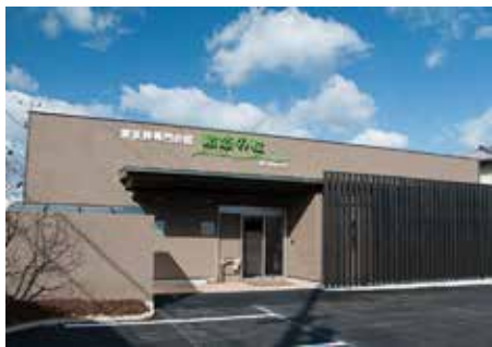
駅から近いきれいな斎場

「倂プラン 30」は、費用を抑えてシンプルにお見送りされたい方におすすめのプランです。充実したオプションとお葬式後のアフターケアまで一貫したサービスをご提供いたします。