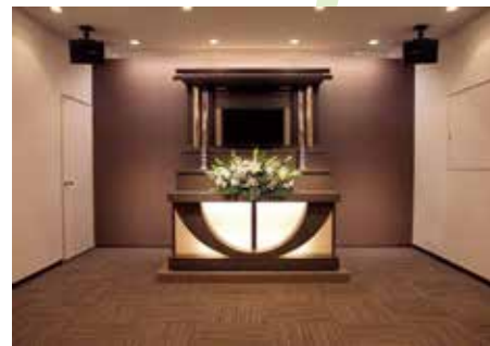
充実した設備・柔軟なサービス