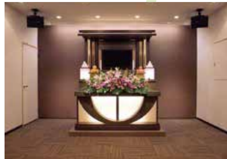
充実した設備・柔軟なサービス